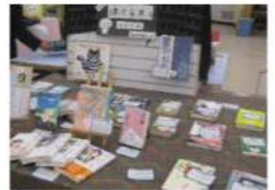
図書室内に色々な展示がありました！