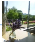
旭地区センター図書室

吉川の端っこ、拾春軒のその先に旭地区センター図書室があります。近くには江戸川や運動場があり、緑豊かな場所で静かに開館しております。小さな図書室なので、欲しい本は探しやすい、面白い本も多く揃え、他の図書館とはひと味違うラインナップを誇っています。窓から見える緑に癒されながら、本を探すひとは素敵な時間になることでしょう。