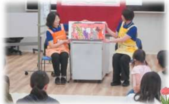
大型えほん『でんしゃ くるかな？』 くるかな？くるかな？ きた～！