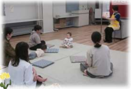
えほん『いろいろおてつだい』 「ありがとう」って言われるとうれしいね♡