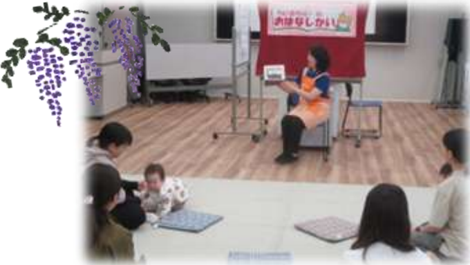
そとでは、おはながさいて おやさいがおおきくそだっているよ

つめたい雨のなか、元気な5組の親子があそびにきてくれました おでかけが楽しくなるようなおはなしや手遊びをしました