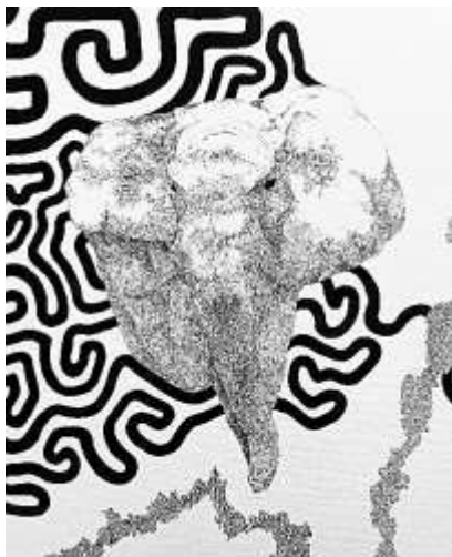
「ゾウ」80.3cm × 65.2cm