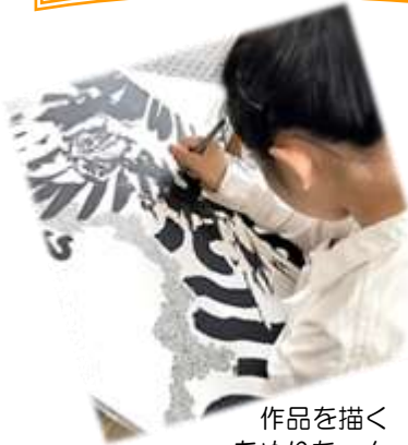
作品を描く あめりちゃん