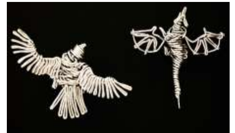
「鳥」(左)長さ4cm 「ドラゴン」(右)長さ5cm