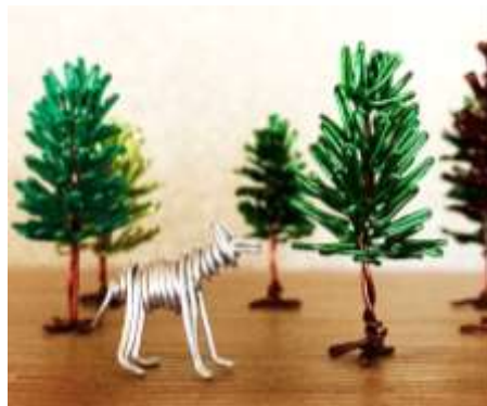
「森」(生きもの)高さ3cm (木)高さ6cm